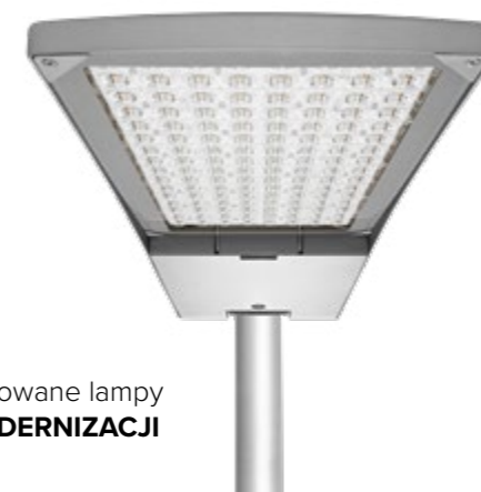
Zamontowane lampy PO MODERNIZACJI

Lampa sodowa 168 W - 161 sztuk Lampa sodowa 279 W - 13 sztuk