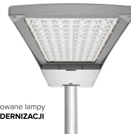
Zamontowane lampy PO MODERNIZACJI

Lampa sodowa 168 W - 161 sztuk Lampa sodowa 279 W - 13 sztuk