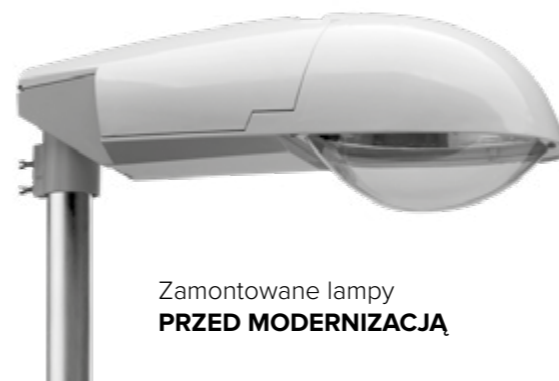
Zamontowane lampy PRZED MODERNIZACJĄ

Wymiana lamp drogowych z sodowych na nowoczesne lampy LED ze sterowaniem, to nie tylko kwestia estetyki, ekologii i wygody, ale przede wszystkim oszczędności . Dzięki tej inwestycji miasto zużyje rocznie o ponad 50% energii elektrycznej mniej i zaoszczędzi prawie 38 000 zł rocznie . W skali 30 lat (tyle wynosi czas użytkowania nowego oświetlenia) inwestycja przynosi oszczędności na poziomie ponad 1 135 000 złotych!