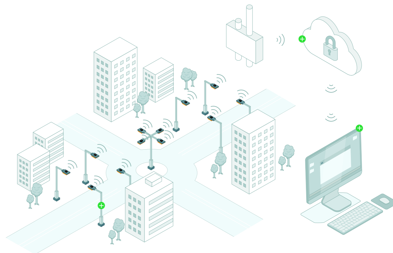
Schemat działania systemu CLUE CITY. Dwukierunkowa komunikacja i zarządzanie oświetleniem.